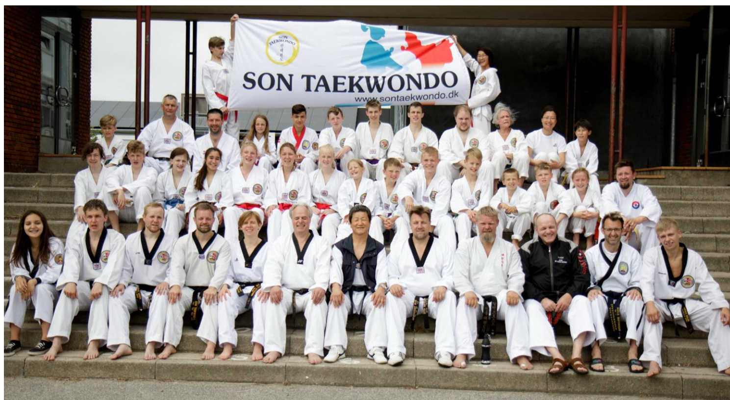
Deltagerne ved "20. Sommerlejr" i 2016 i Kalundborg

Som arrangør af Son Taekwondo Samvirkes 21. sommerlejr er det en utrolig stor glæde for Støvring Son Taekwondo at kunne invitere på sommer- og familielejr i Frejlev. Byen ligger næsten midt imellem Aalborg og Nibe, som ligger op til Limfjorden og fjordens smukke landskab! Jeg vil derfor på vegne af Støvring Son Taekwondo byde dig, din familie og venner hjertelig velkommen til: